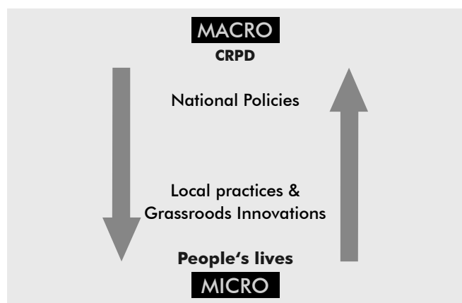
Fig 1.1: Reducing the gaps between CRPD, National Policies, Local Practices and People's lives

ommendations about how to develop, scale-up or replicate inclusive policies and practices, based on what is already working well.