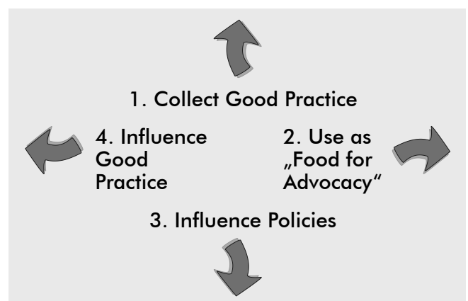
Fig.1.2: The cycle from good practice to good policy