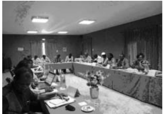
Fig. 1.3. First meeting of the regional committee, held on the 13th and 14th October 2009 in Dakar.

Les Droits en ActionS is led by a multi-stakeholder steering committee of organizations specialized in disability, women's leadership, local development and governance, comprising Handicap International, the Secretariat of the Africa Decade of Persons with Disabilities, ENDA Tiers Monde, Partnership for Municipality and Development (PDM), Women in Law and Development in Africa (WILDAF), Christian Blind Mission (CBM), and Action for Disability and Development (ADD).